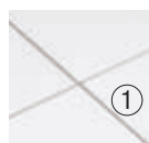
1. Lyra® PB Vector® con sistema de suspensión Prelude® XL® de 15/16"

TechLine 877 276-7876 armstrongceilings.com (seleccione su país)